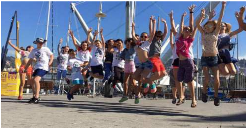
4 NAVE Italia

http://echo24.cz/a/wXTEJ/nave-italia-ceske-deti-se-vratily-z-plavby-na-italske-plachetnici